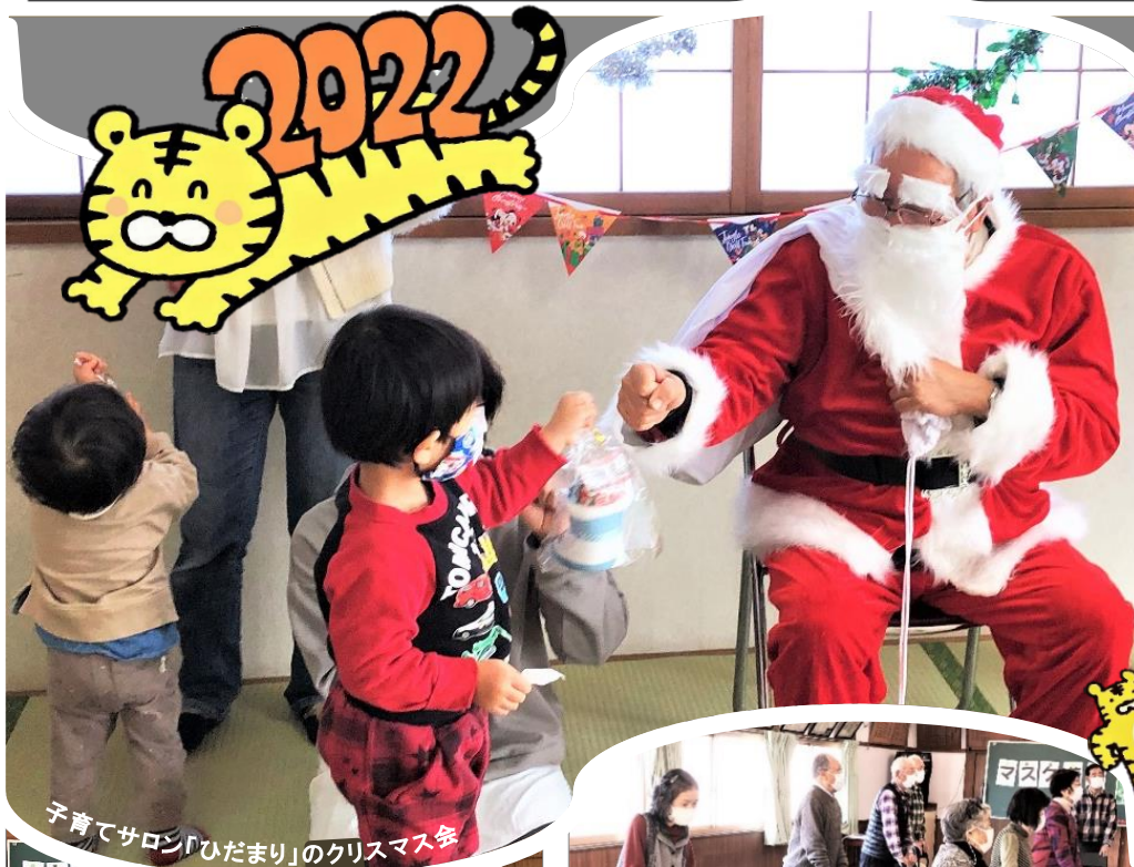
子育てサロン「ひだまり」のクリスマス会