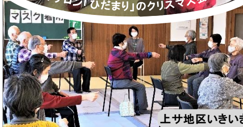
上サ地区いきいき百歳体操再開しました