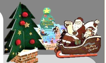
会食参加者にクリスマスカード と年賀状をお届けしました